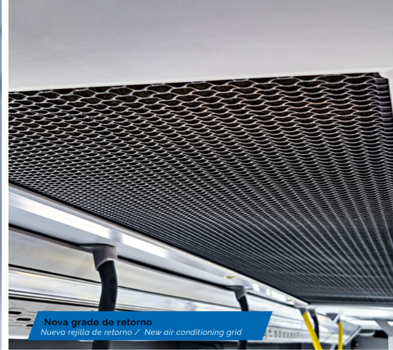
Nova grade de retorno Nueva rejilla de retorno / New air conditioning grid