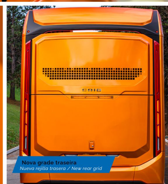
Nova grade traseira Nueva rejilla trasera / New rear grid