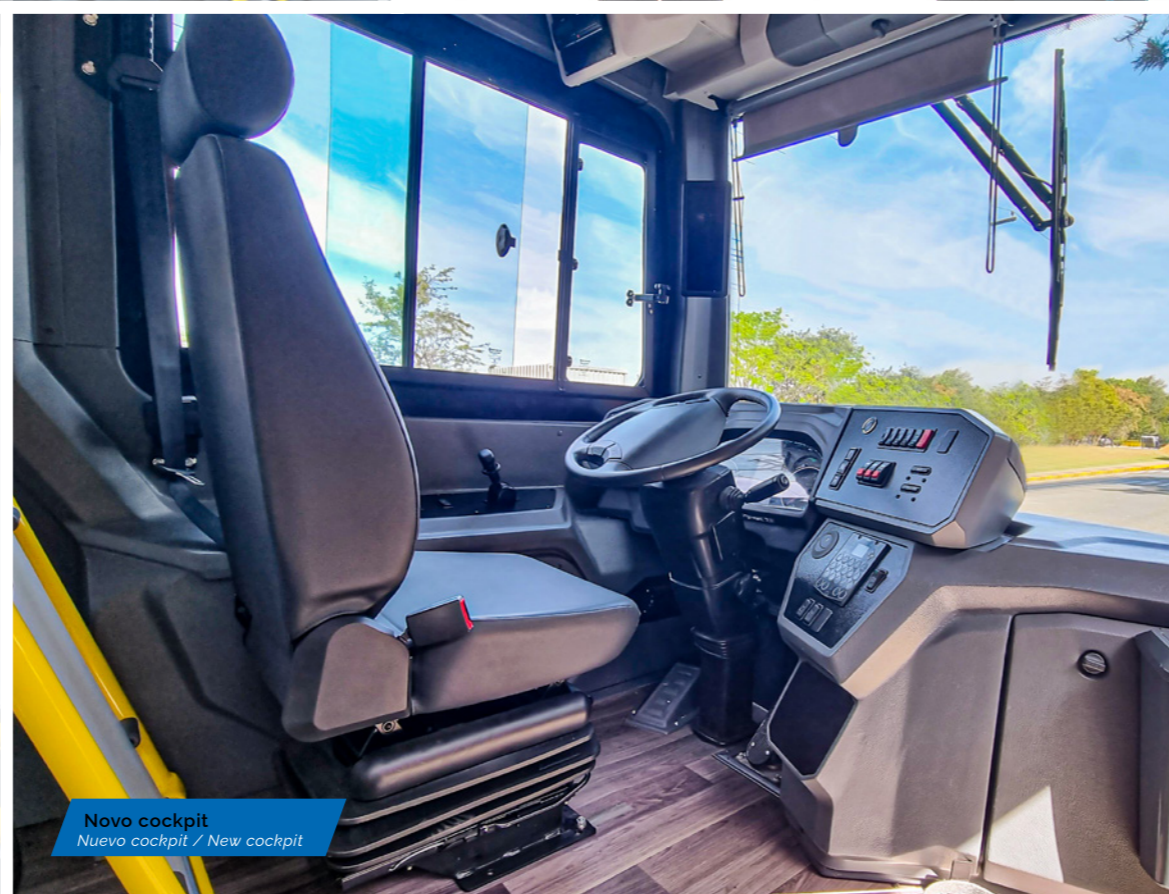
Novo cockpit Nuevo cockpit / New cockpit