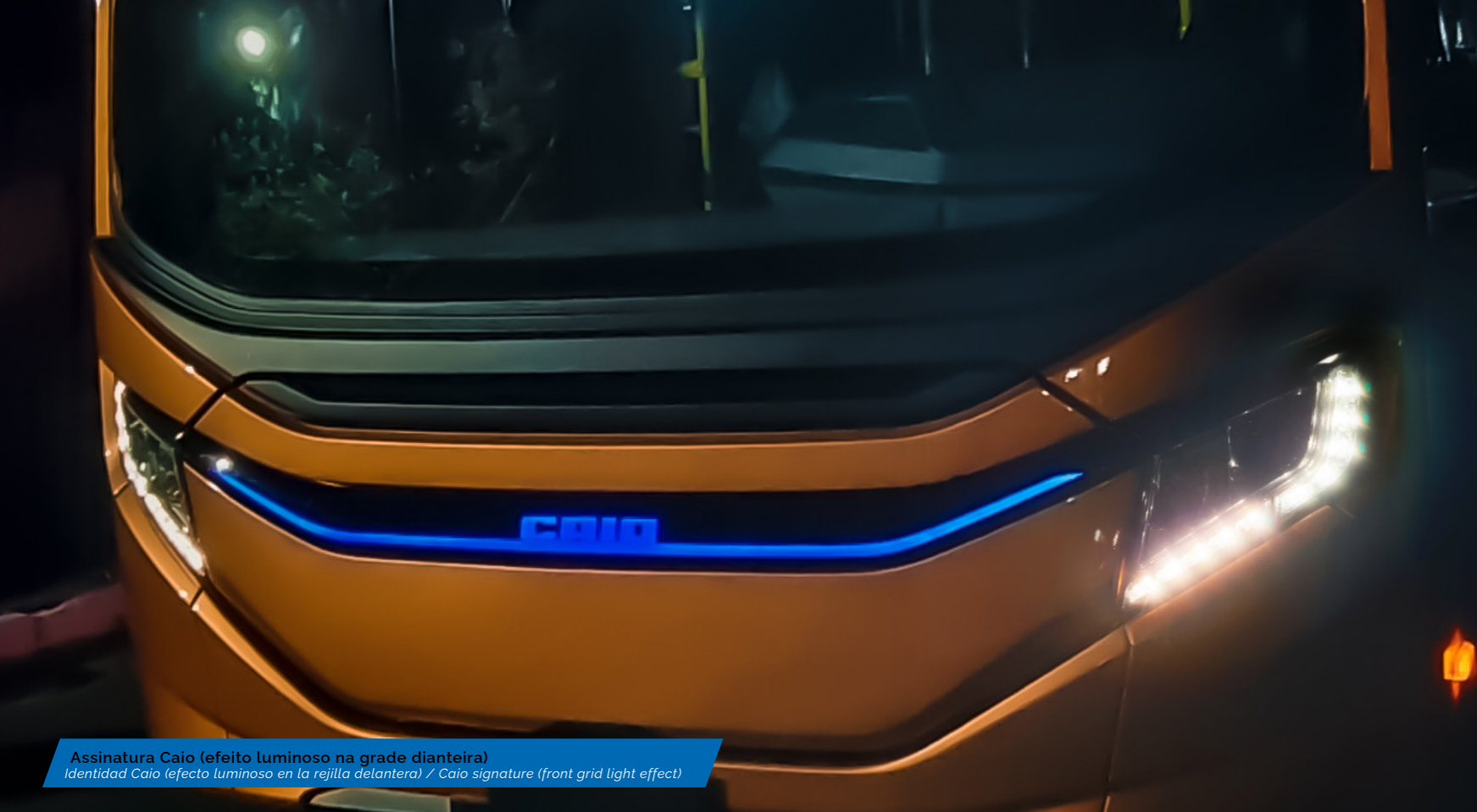
Assinatura Caio (efeito luminoso na grade dianteira) Identidad Caio (efecto luminoso en la rejilla delantera) / Caio signature (front grid light effect)