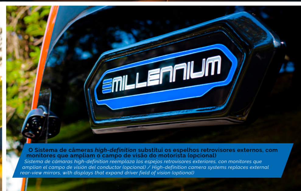
O Sistema de câmeras high-definition substitui os espelhos retrovisores externos, com monitores que ampliam o campo de visão do motorista (opcional) Sistema de câmaras high-definition reemplaza los espejos retrovisores exteriores, con monitores que amplían el campo de visión del conductor (opcional) / High-definition camera systems replaces external rear-view mirrors, with displays that expand driver field of vision (optional)