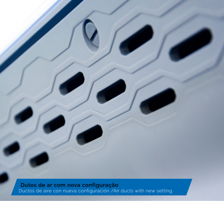
Dutos de ar com nova configuração Ductos de aire con nueva configuración / Air ducts with new setting